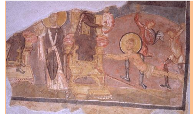
Martirio de San Erasmo (Siglo VIII)

Desde 1658 a 1662, Pedro Berrettini de Cortona, construye el Atrio y la espléndida fachada de la Iglesia. Desde el atrio realiza una doble entrada a la cripta, para permitir el acceso de los peregrinos al lugar venerado como prisión de San Pablo.