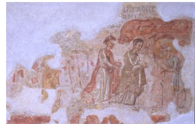
Historia de los siete durmientes de Efeso (Siglo VII)

En 1960 el Consejo Superior de Antiquidades y Bellas Artes dispone el despegue de los frescos y descubre que muchos de ellos esconden un sustrato de pinturas más antiguas.